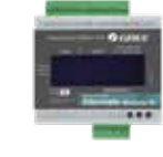
Gree Alternate Wireless IR